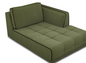
CH00R Chaise longue droite (114 cm x 83 cm x 162 cm)