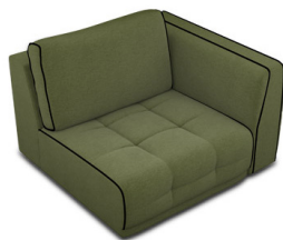
B100R Bat. droit 1 place (111 cm x 83 cm x 107 cm)