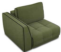
B100L Bat. gauche 1 place (111 cm x 83 cm x 107 cm)