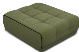
P000 Pouf rectangulaire (89 cm x 42 cm x 107 cm)