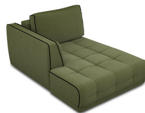
CH00L Chaise longue gauche (114 cm x 83 cm x 162 cm)