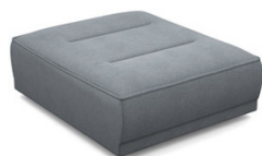
P000 (89 cm x 42 cm x 107 cm)