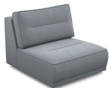
E100 (88 cm x 83 cm x 107 cm)

Modules disponibles (Available modules):