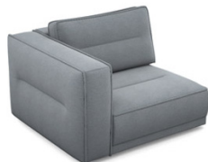
B100L (114 cm x 83 cm x 107 cm)