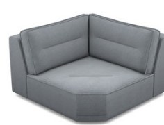
EK01 (125 cm x 83 cm x 125 cm)