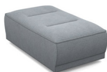
P003 (60 cm x 42 cm x 107 cm)