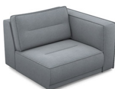
B100R (114 cm x 83 cm x 107 cm)