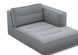
CH00R (118 cm x 83 cm x 162 cm)